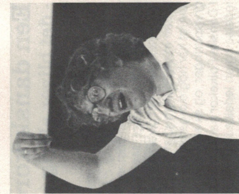
Den nordiske dirigent Carl Høgset.

Imidlertid: Ud af det store forarbejde var etableret en række velfungerende grupper, og det blev en meget fornem koncert, der om fredagen fremviste resultatet af 5 dages intenst arbejde.