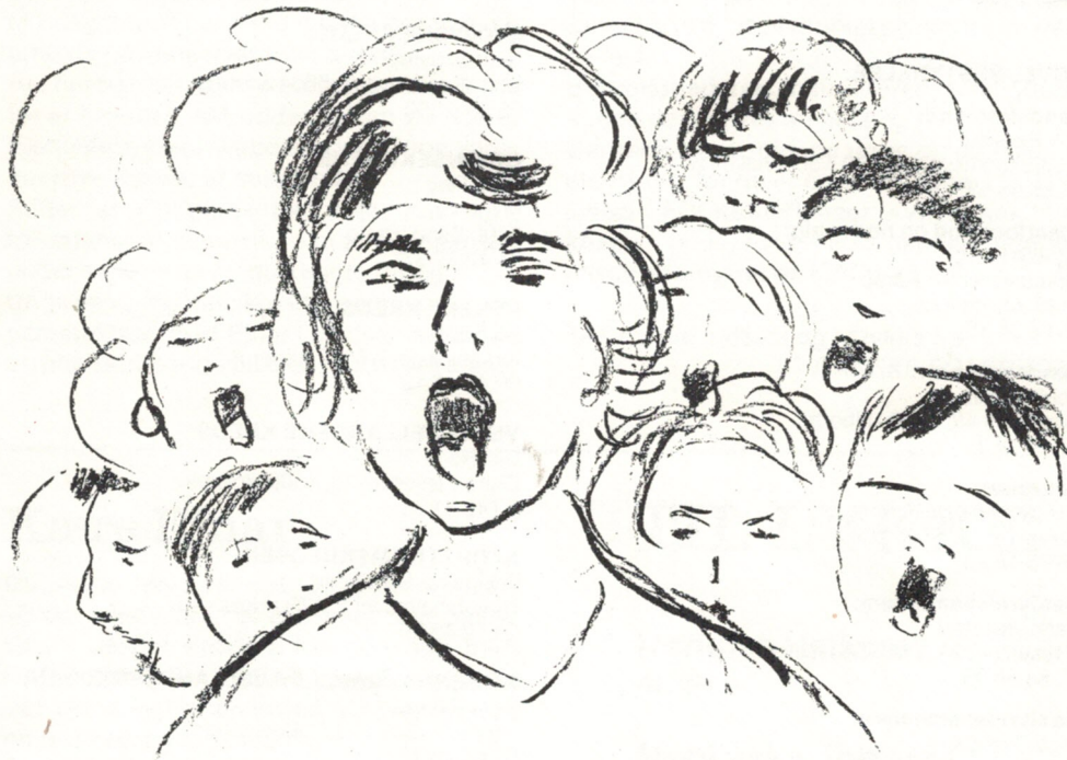
Danebod-stemning af Ole Gundtoft.