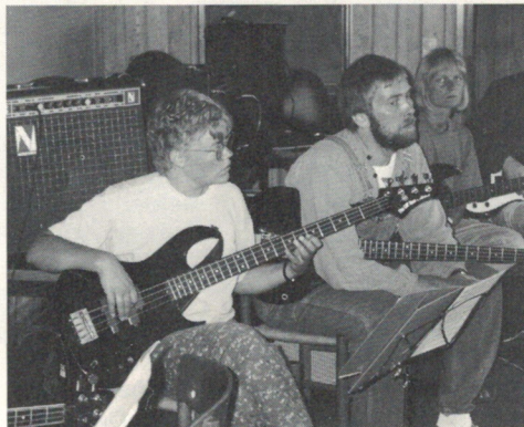
Musiklærere i en el-baslektion